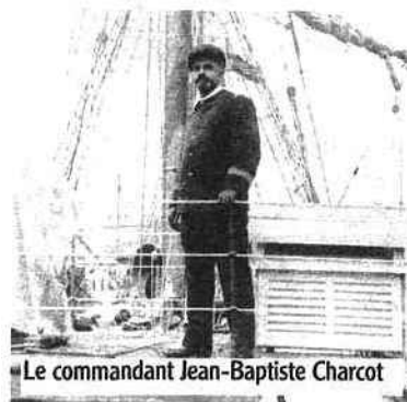
Le commandant Jean-Baptiste Charcot