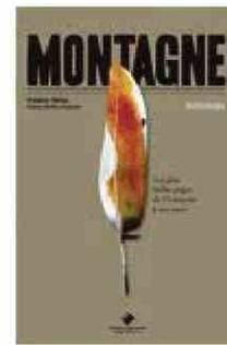
FRÉDÉRIC THIRIEZ MONTAGNE : LES PLUS BELLES PAGES DE L'ANTIQUITÉ À NOS JOURS Editions du Mont- Blanc, 534 pp., 25 €.