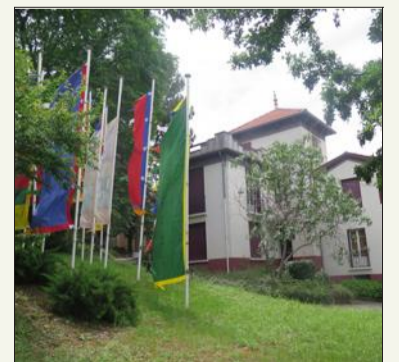
Samten Dzong où l'aventurière passa la deuxième partie de sa vie.