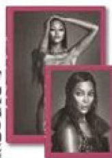
Naomi , Taschen, 522 pages + volume complémentaire de 300 pages, 100 €.

PREMIÈRE TOP MODEL NOIRE à figurer sur la couverture de Vogue France et de Time . Naomi Campbell reste à 50 ans l'incarnation de la beauté. Démarche chaloupée, provocatrice, celle qui a fait sa première apparition à l'âge de 7 ans dans le clip de la chanson de Bob Marley «Is This Love», est aujourd'hui entrepreneure, artiste et militante. Le livre-objet qui lui est consacré propose un voyage dans le monde de la