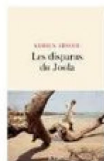
ADRIEN ABSOLU. Les Disparus du Joofa , JC Lattès, 250 pages, 19 €.

À ZIGUINCHOR, en Casamance (Sénégal), un monument commémore la tragédie dans un parc au bord du fleuve. On peut y lire : «Place des naufragés du bateau le Joofa ». Mais qui se souvient de l'un des naufrages les plus meurtriers de la dernière décennie ? Près de 2000 morts. Plus que le nombre de victimes à bord du Titanic . Le 26 septembre 2002, le Joofa , parti de Ziguinchor pour Dakar, sombre au large de la Gambie. En 2003, la justice sénégalaise classe le dossier, concluant à la seule responsabilité