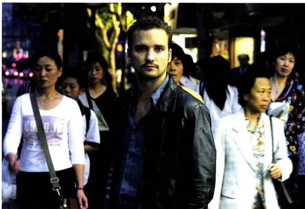
AT in Shanghai © Kevin Lee