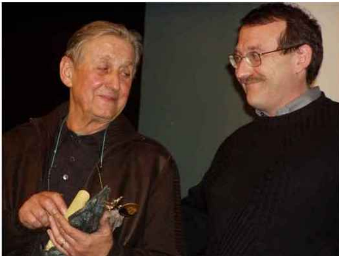
René Desmaison.

En un livre, unique par son poids (4 kilos), son prix aussi (99), 100 cordées se retrouvent par les mots, l'esprit et