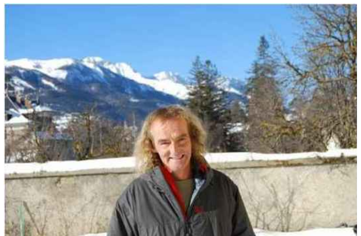
Patrick Edlinger.

Forcément, on pourra objecter, regretter, contester. Et pourquoi, untel ou untel – au hasard, Marc Batard – n'y est pas ? Pour atténuer un peu la difficulté de la sélection, l'éditeur a finement joué. Afin de réaliser ces portraits, elle a fait appel à 100 plumes, alpinistes pour la plupart et parfois prestigieuses. Quand les évocations ne sont pas signées par des écrivains ou journalistes célèbres dont le cœur bat pour la montagne.