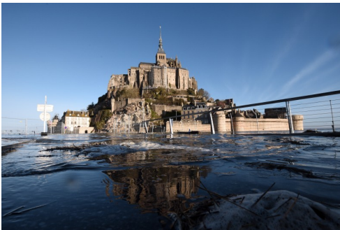
Le Mont Saint-Michel lors de la grande marée le 22 février 2015

La 2ème vie des héros de bande-dessinée, confidences d'un pilote de ligne et Mont Saint-Michel. La Curiosité Est Un Vilain Défaut du 21 janvier 2016