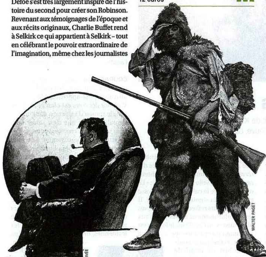
SIDNEY PAGET

La Vérité sur Robinson et Vendredi, de Charlie Buffet, Paulsen , 178 pages, 12 euros ■■■