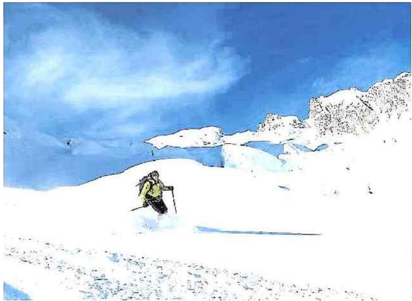
Faire sa trace dans la vallée Blanche: 23 km de poudreuse :

La vallée Blanche, un hors-piste géant. « Glisse glaciaire à vos risques et périls », prévient un tourniquet au sommet d'une arête vertigineuse ! Agrémentée depuis décembre d'une plate-forme bien nommée « pas dans le vide », l'aiguille du Midi peut